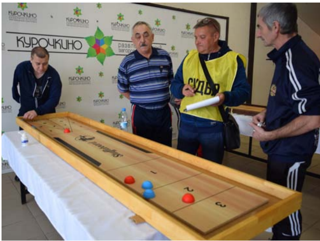
(Продолжение. Начало на 1-й стр.)

28–29 октября в развлекательном загородном комплексе «Курочкино» (г. Копейск) прошел Областной турнир по спортивным настольным играм среди людей с ограниченными возможностями здоровья Челябинской области, в котором приняли участие более 60 человек.