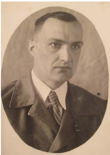
ТРУДИЛИСЬ ПО 16 ЧАСОВ В СУТКИ

Чем дальше победный май 1945 года, тем дороже и значительнее каждое слово свидетелей самых страшных и героических лет в истории нашей страны. Важно, чтобы потомки знали, что пришлось пережить их близким людям в тяжелые годы войны.