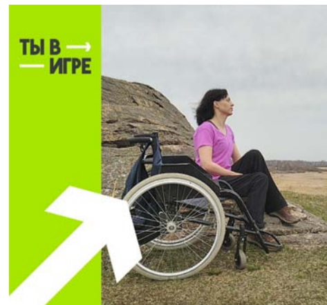
ТЫ В ИГРЕ