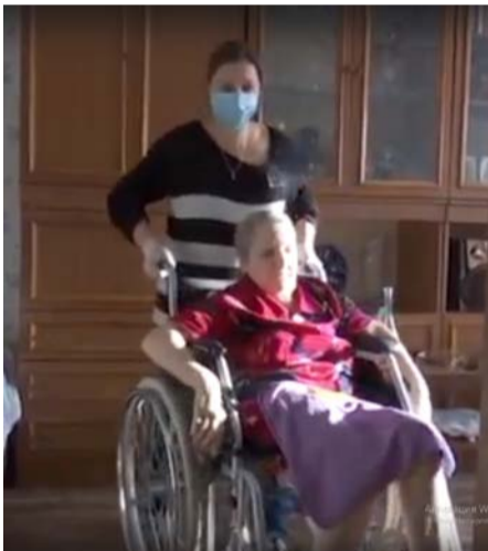
ПАНДЕМИЯ МЕШАЛА, А МЫ ПОМОГАЛИ

Творческие работы участников проекта https://www.youtube.com/watch?v=DdyOdWo6rMQ https://www.youtube.com/watch?v=bUFxQSda68A&t=13s