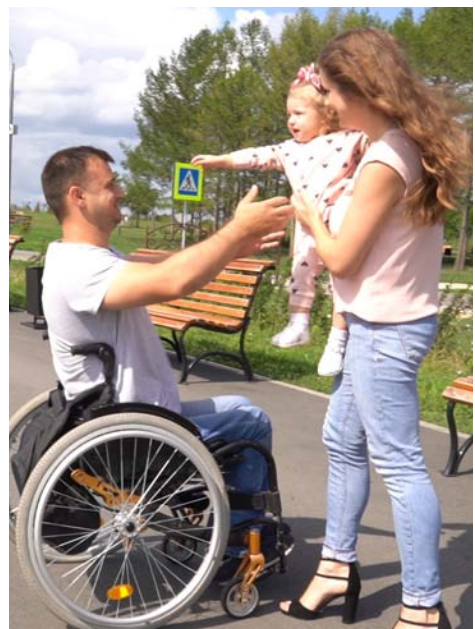
Съемки фильма «Спасибо»