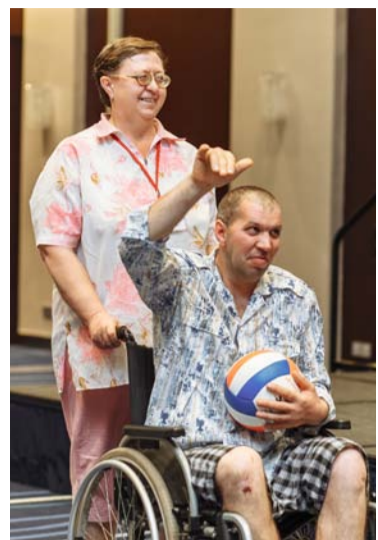
Коллекция Курганской области

– В этом году мы плавно перешли от одного юбилея к другому: