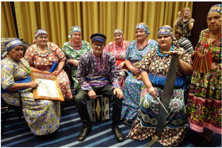
Ансамбль «Селяночка» из Красноармейского района