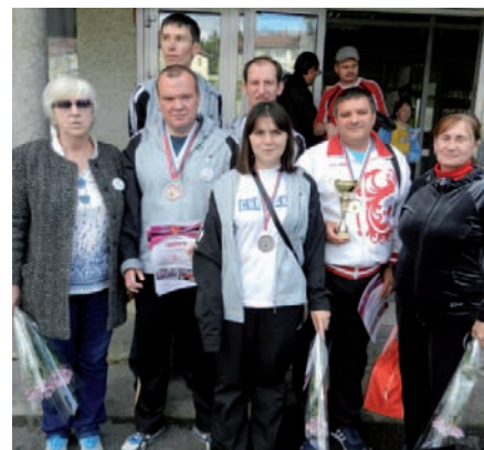
Снежинская команда в Трёхгорном