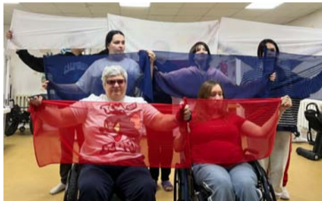
С дочерьми на репетиции