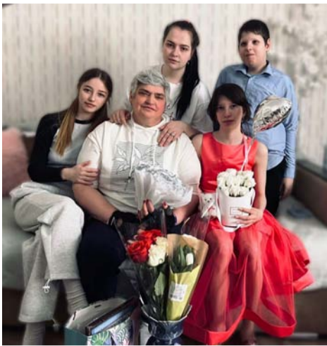
(Продолжение. Начало на 1-й стр.)

«Сильная, добрая, справедливая, заботливая...»