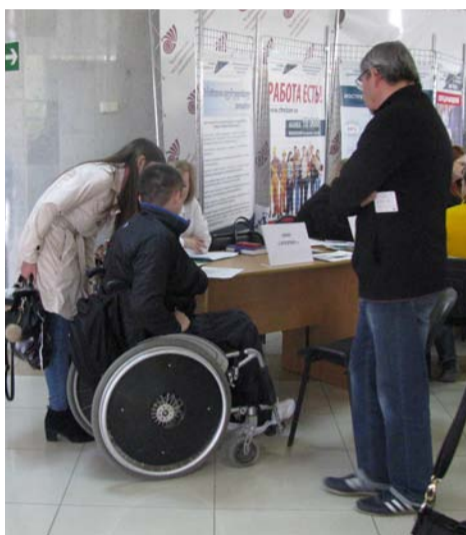
ШВЕЯ – В ПРИОРИТЕТЕ

В конце мая в Челябинске завершился региональный чемпионат. Он проходил на десяти площадках. Основными из них стали образовательный комплекс «Смена» и Челябинский государственный университет. В этом году чемпионат собрал 365 участников из 72 учебных заведений региона. Их работы оценивали эксперты, в том числе работодатели.