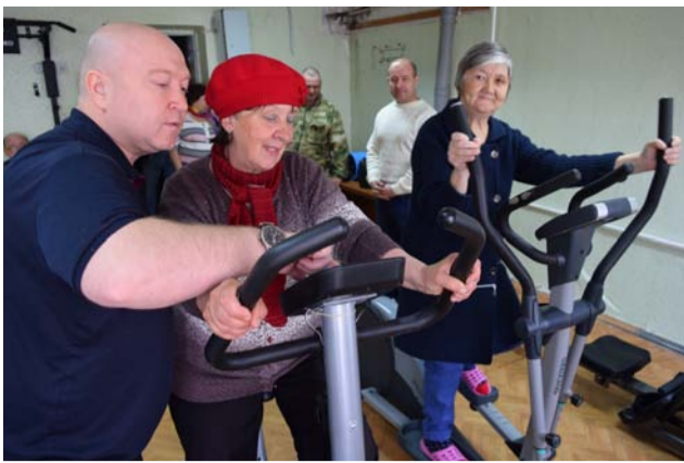
24 мая мы провели сразу два мастер-класса по занятиям на тренажёрах – в городах Катав-Ивановск и Усть-Катав.